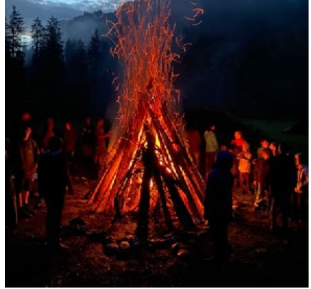
Ein grosses Abschlussfeuer am Ende des Solas.