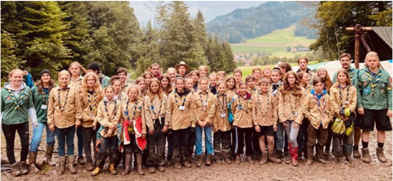
Zu Gast im alten Schottland: die Abteilungen Wellenberg, Bürglen und Sturmvogel.