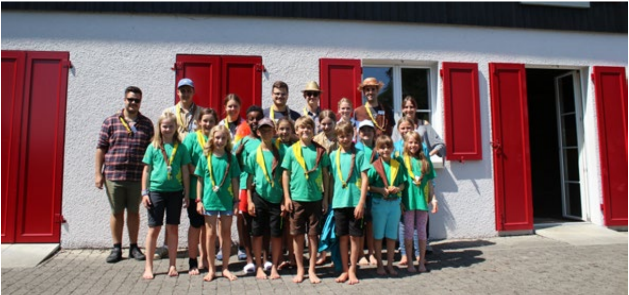
Klein aber fein: das Sommerlager-Trüppi der Abteilung Seesturm.