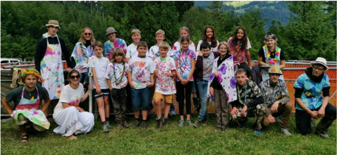
Selbstgemachte Batik-Shirts und good Vibes in Riedern am Klöntalersee mit der Abteilung Seebachtal.