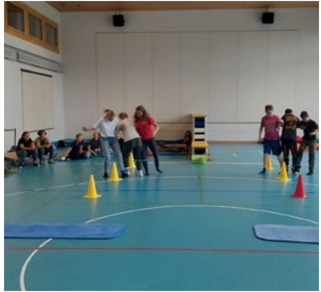
Sportlich bei einer Gruppen-Staffette.