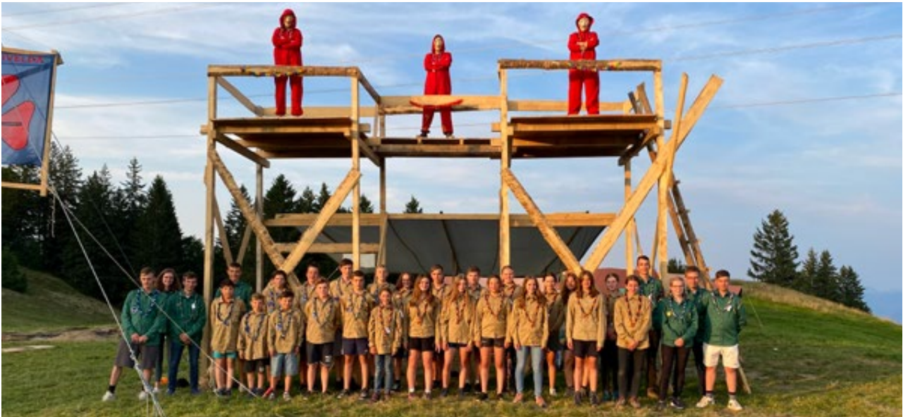
Die Teilnehmenden und Leitenden des Sommerlagers der Abteilungen Quivelda und Helfenberg in Trogen.