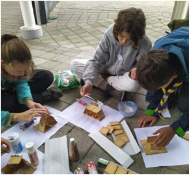
Die Leitpfadis bauen Häuschen aus Butterkecksen.