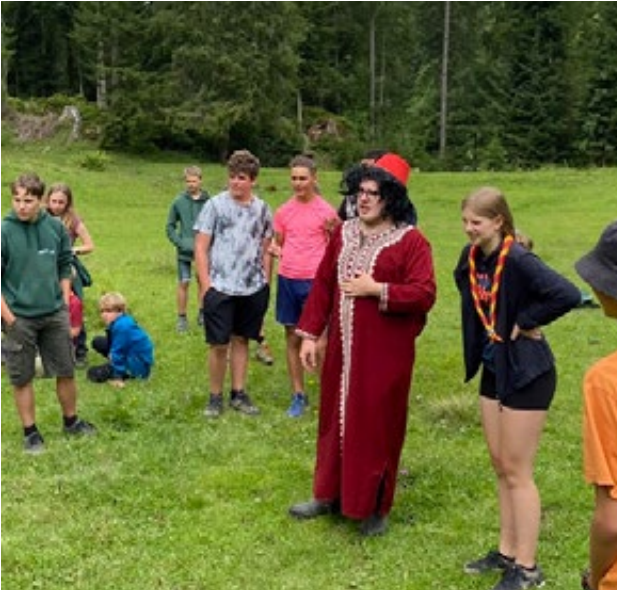
Die Pfadis treffen fremde Völker am Ende der Welt.