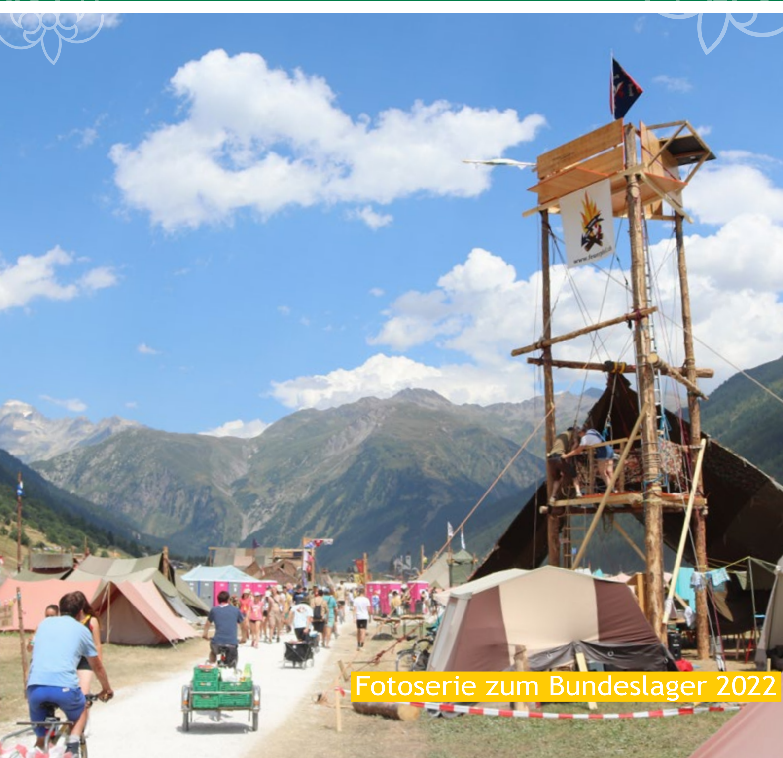
Fotoserie zum Bundeslager 2022