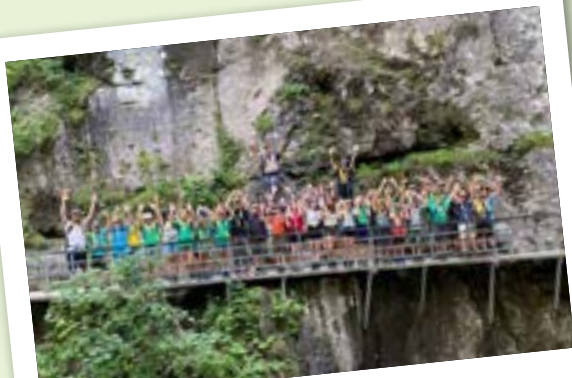
St. Niklaus und Seesturm (in Giswil)