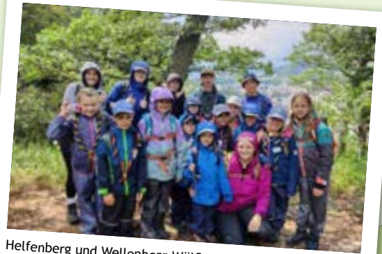
Helfenberg und Wellenberg Wölflü (in Aarburg)