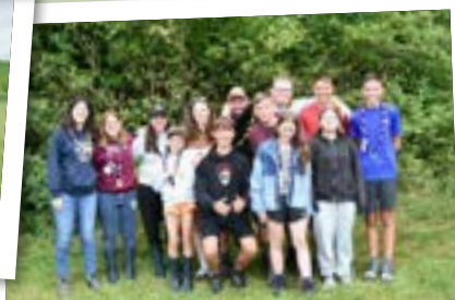
... und Olymp (in Schongau)