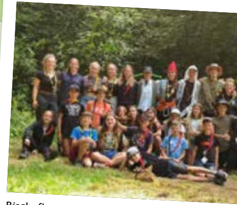
Bischofberg und Libelle (in Wilchingen)