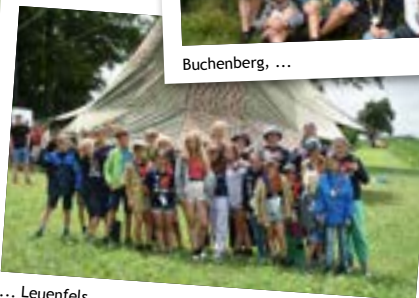
... Leuenfels ...