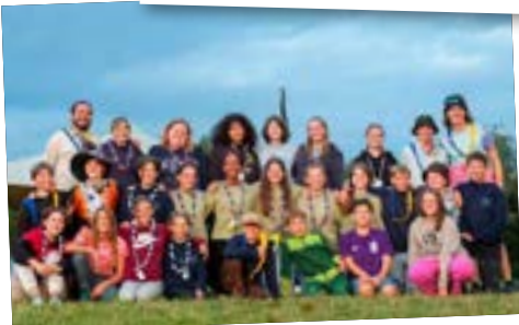
Arbor Felix und Seemöve (in Nottwil)