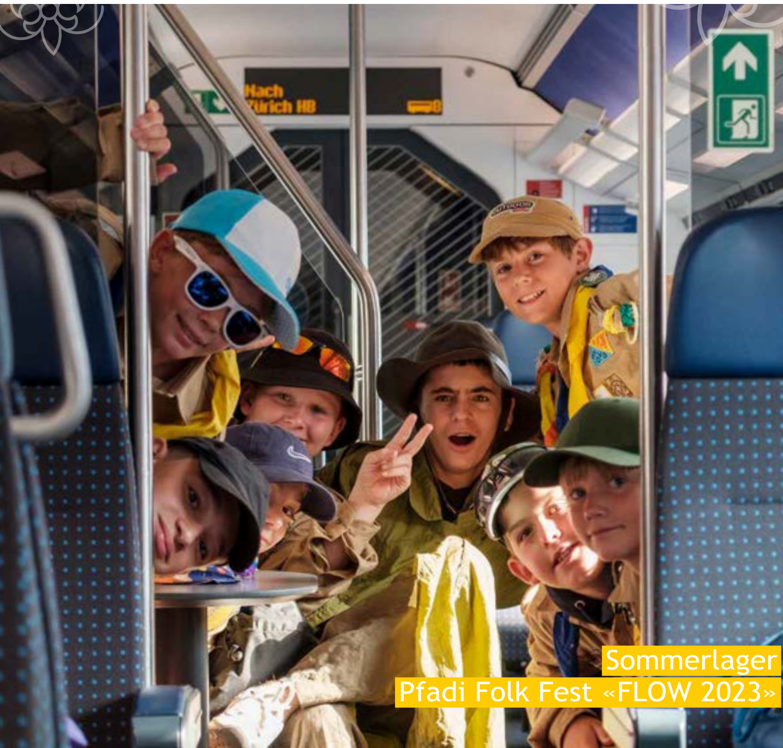
Sommerlager Pfadi Folk Fest «FLOW 2023»