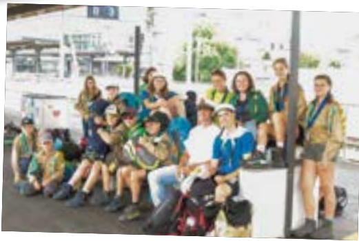
Sturmvogel und HTG (in Oberrüti)