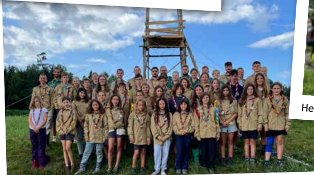
Feuerpfeil, Wyfelde und Quivelda (in Amriswil)